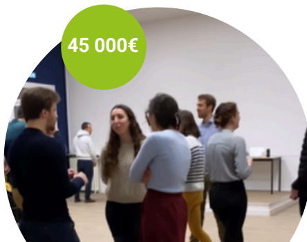
Aumônerie des jeunes Ad Altum, bar associatif 4L à Reims Cuisine, peinture, électricité.