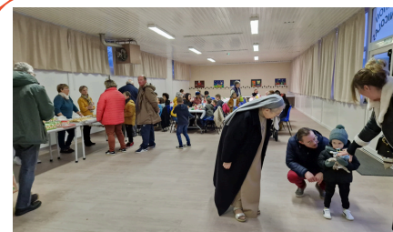
Salle paroissiale de Signy-le-Petit à 20 km de Rocroi Ardennes Nord