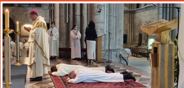
Cathédrale de Reims, 23 juin 2024

N : Pour moi, c'est important déjà d'être à l'écoute de son époux, de ses difficultés et d'être en soutien aussi. Mais je pense que c'était important de le faire en toute discrétion parce que de toute façon, l'épouse n'est pas ordonnée et elle est juste là pour l'accompagner, pour prier pour lui, pour notre couple, pour notre famille et être un peu une veilleuse et une garante pour assurer une sûreté dans l'agenda et dans la vie familiale.