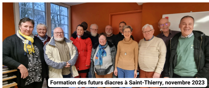
Formation des futurs diacres à Saint-Thierry, novembre 2023