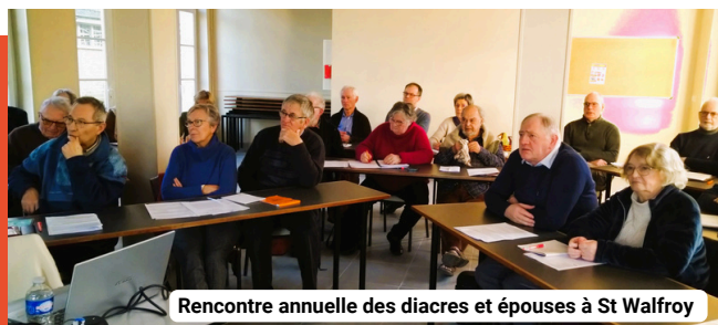
Rencontre annuelle des diacres et épouses à St Walfroy