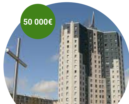
Tour des Argonautes - Reims ouest Peinture, cuisine, toilettes PMR.