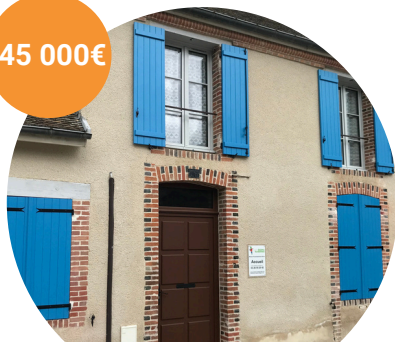
Salle paroissiale d'Aÿ (accès, isolation, baie vitrée sono...)